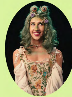
Marie S'infiltrer La Grenouille