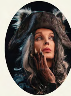
Arielle Dombasle Le Loup