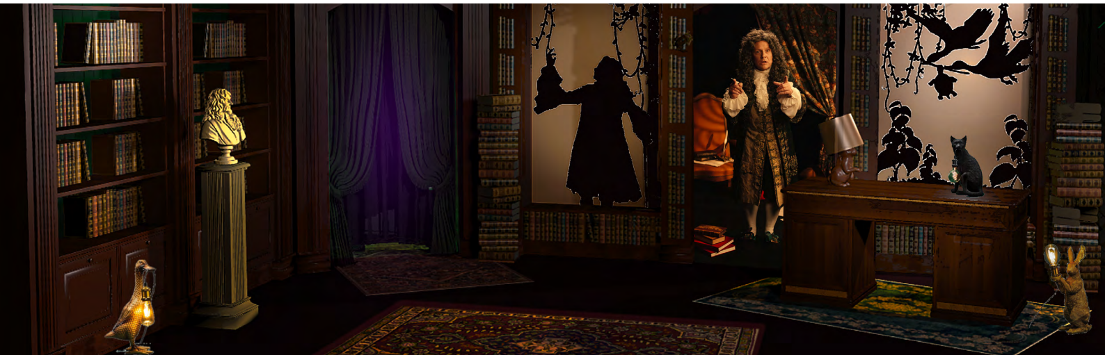
Le bureau de La Fontaine @ Ateliers BK