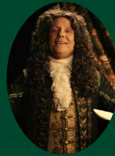
Laurent Stocker Jean de La Fontaine