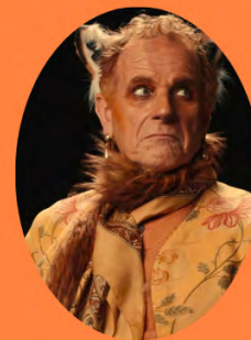
Charles Berling Le Renard